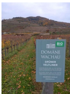
Domane WACHAU besöker vi