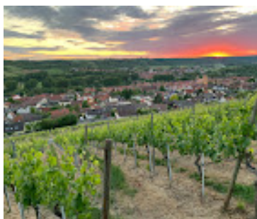
Härlig utsikt i Würzburg