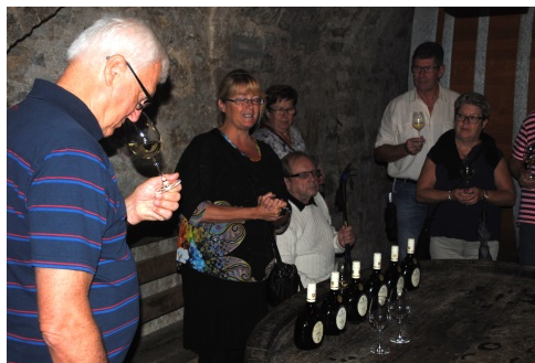
Vinprovning från "bocksbeutel"-flaskan